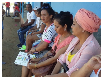
Protagonistas del taller: primer año carrera Gestión Sociocultural para el Desarrollo, con matrícula de 15 alumnos.