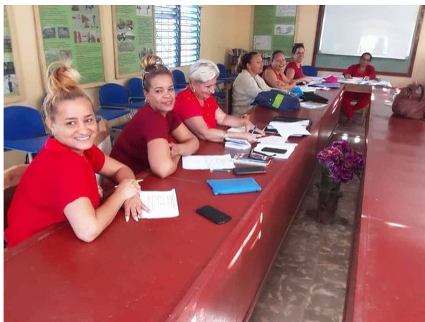
Protagonistas principales del taller: primer año de la especialidad Técnico Superior en Desarrollo Local Sostenible.